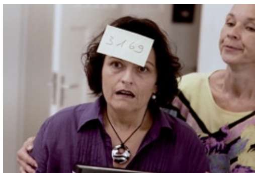
Die Mandanten als Aktenzeichen - nicht bei MIZ.